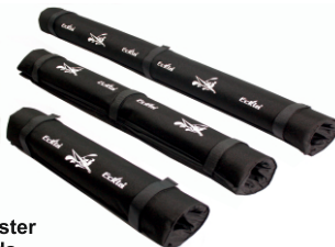
ECKLA-Transportpolster ECKLA-transport pads