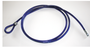
ECKLA DIEBSTAHL-SICHERUNGSSEIL Anti-theft steel-cable