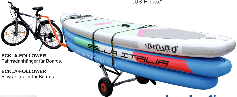
ECKLA-FOLLOWER Fahrradanhänger für Boards.