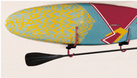
ECKLA-SURF-PORT Board-Wandhalter. schwenkbar.