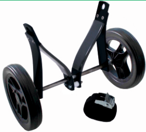
ORKCA - Alaska - Kajakwagen Artikel Nr. Item no. 1280