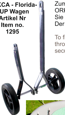
ORKCA - Florida- SUP Wagen Artikel Nr Item no. 1295

Zum fixieren des Surfboards führen Sie den längeren Arm des ORKCA Florida durch die Trageschleufe am Board. Optional können Sie es noch mit einem Zurrurt sichern.