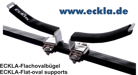
ECKLA-Flachovalbügel ECKLA-Flat-oval supports